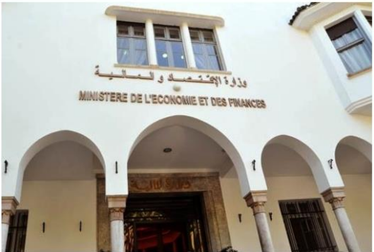
Siège du ministère de l'Économie et des Finances à Rabat